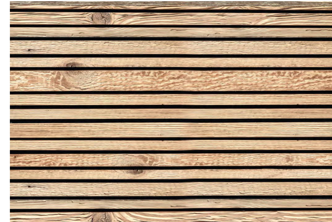
Marilyne S3, ALTHOLZ 1