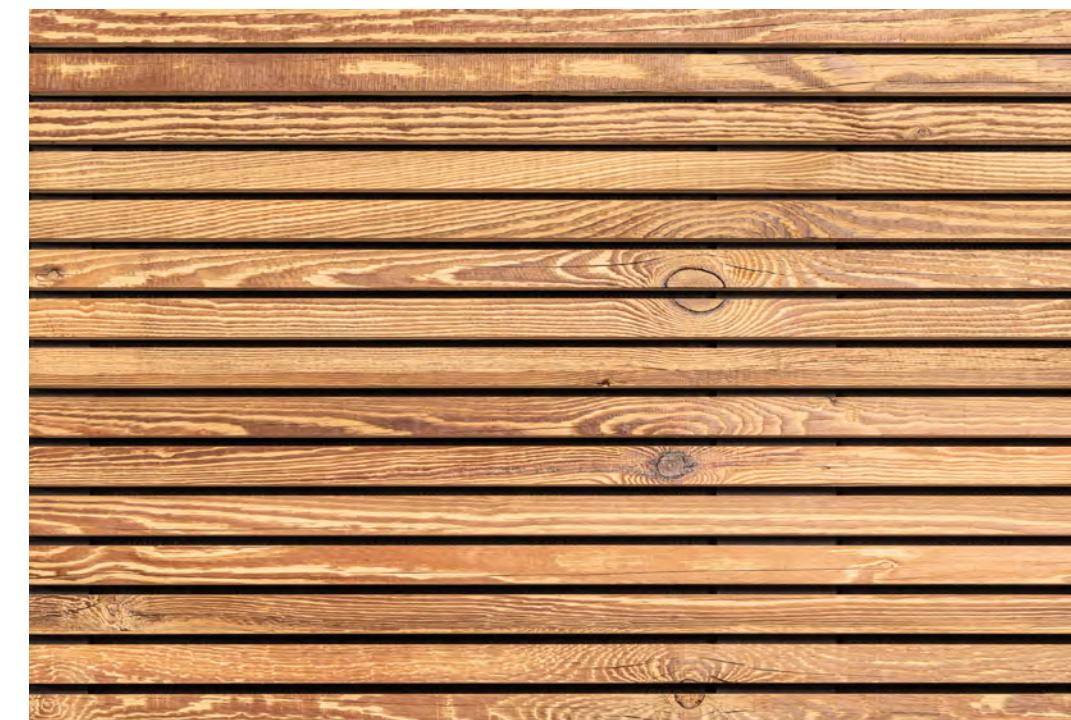
Marilyne 8/25, ALTHOLZ 4

Pannelli acustici con strato di superficie in legno vecchio