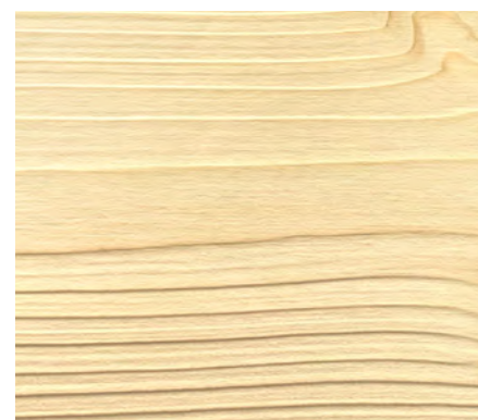
Spazzolatura o rusticatura